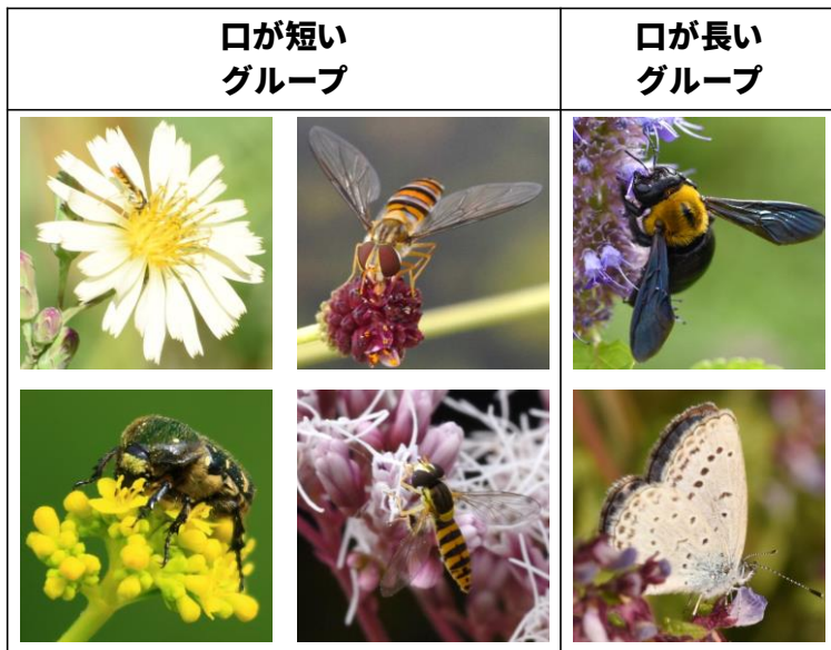
図2. お皿状になった花は蜜までの距離が短く、口が短いアブやハエ、コガネムシにとって食べやすい。また、白色や黄色の花はハエを誘因しやすく、お皿状で白・黄色の花はハエをパートナーにしていると考えられる。アブやハエは時期を問わず多くいるため、植物に重宝されているのではないだろうか。

一方、ベル状になった花は蜜までの距離が長いため、口が長いハナバチやチョウにとって食べやすい。ハチは青色の花をよく好むようで、ベル状で青色の花はハナバチをパートナーにしていると考えられる。