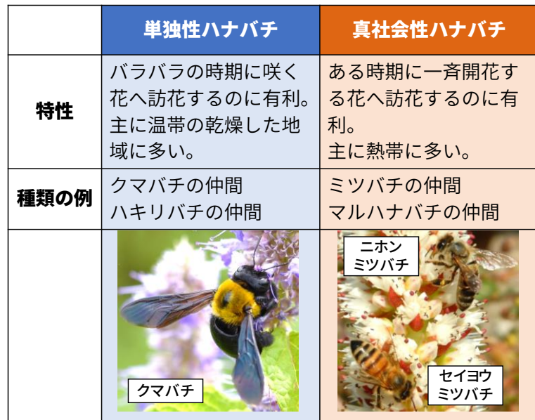
表1. 単独性と真社会性のハナバチの特性。

んな問題が起こるのでしょうか？外来の真社会性ハナバチ類は、外来の植物の花によく集まる傾向があります（Aizen et al., 2008; Goulson, 2003）。つまり、競合（図3）によって在来のハナバチ類を少なくしてしまうだけでなく、在来の植物も共に減らしてしまう可能性もあるということです。近年、世界各地でセイヨウミツバチの蜂群崩壊症候群が起こっています（Currie et al., 2010; vanEngelsdorp et al., 2010; Van der Zee et al., 2012）。蜂群崩壊症候群とは、ミツバチの群れに女王バチや幼虫が巣箱にいるのにも関わらず、働きバチがどこかへ消えてしまうという謎の現象で、なぜ起こるのか分かっていません。これが、セイヨウミツバチが居着いたために、在来ハナバチ類が少なくなった地域で起こってしまうと、在来植物の受粉が満足にできなくなり、生態系が大きく崩れてしまうかもしれません。