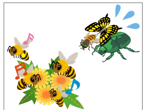
図3. 競合の例。この例ではミツバチが優占して蜜を採取しており、他の訪花性昆虫が食べる量が少なくなっている。

んな問題が起こるのでしょうか？外来の真社会性ハナバチ類は、外来の植物の花によく集まる傾向があります（Aizen et al., 2008; Goulson, 2003）。つまり、競合（図3）によって在来のハナバチ類を少なくしてしまうだけでなく、在来の植物も共に減らしてしまう可能性もあるということです。近年、世界各地でセイヨウミツバチの蜂群崩壊症候群が起こっています（Currie et al., 2010; vanEngelsdorp et al., 2010; Van der Zee et al., 2012）。蜂群崩壊症候群とは、ミツバチの群れに女王バチや幼虫が巣箱にいるのにも関わらず、働きバチがどこかへ消えてしまうという謎の現象で、なぜ起こるのか分かっていません。これが、セイヨウミツバチが居着いたために、在来ハナバチ類が少なくなった地域で起こってしまうと、在来植物の受粉が満足にできなくなり、生態系が大きく崩れてしまうかもしれません。