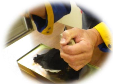
「ほくち」に火をつける