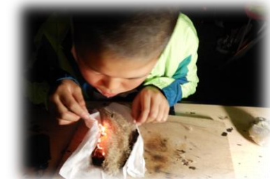
じっくり火を育てる