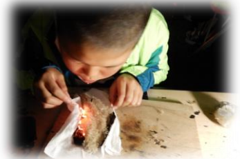
じっくり火を育てる