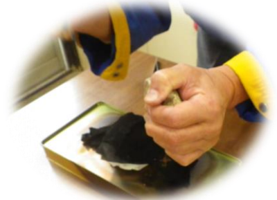
「ほくち」に火をつける